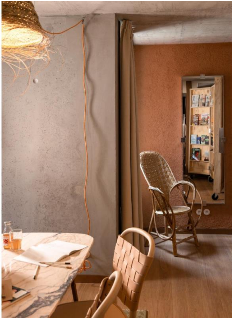
Un bureau ou une salle de réunion en chambre pour les travailleurs nomades